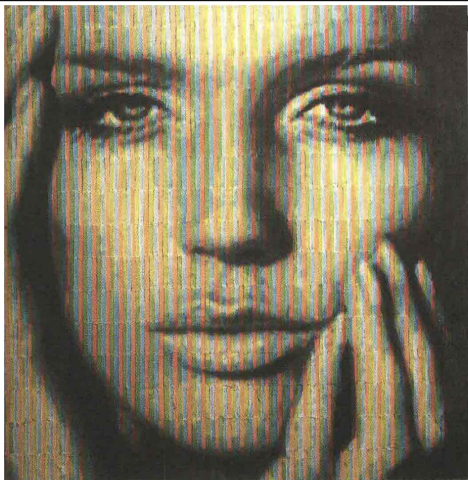
Veruska, Gian Piero Gasparini, tecnica mista, 2012, 150x150